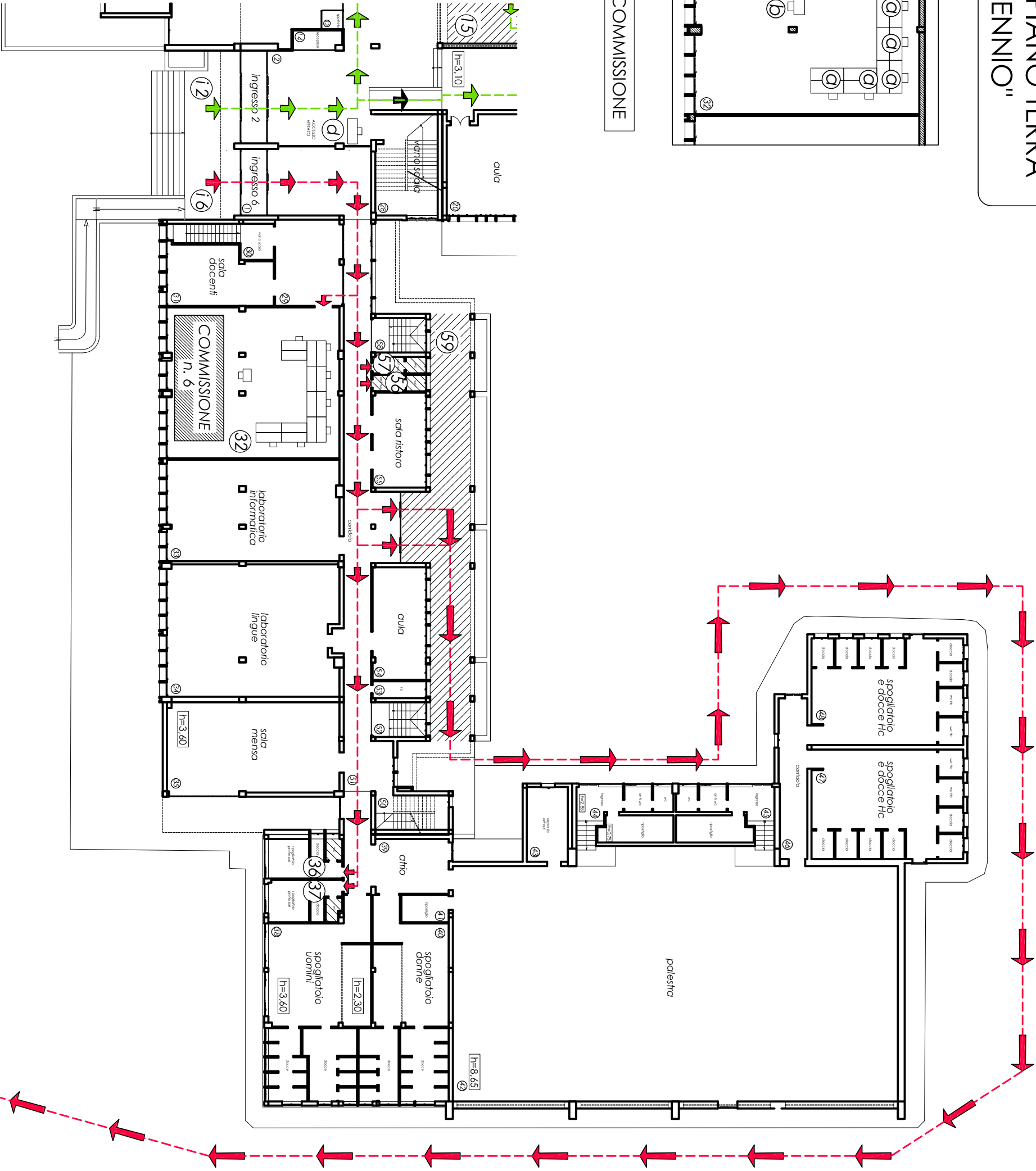
PIANTA PIANO TERRA